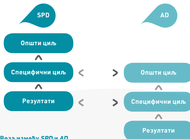
Слика бр. 1: Веза између SPD и AD

Акције представљају логичан скуп координисаних активности које се спроводе ради достизања дефинисаног циља, имају процењене укупне трошкове као и план спровођења и пратеће индикаторе. Свака појединачна активност у фази програмирања мора бити дефинисана у погледу трошкова (процењеног буџета за реализацију) и типа финансирања (спровођења). Могу постојати две врсте акција: секторска акција (Sector support Action) и појединачна акција (Stand – alone Action) која је по својој природи хоризонтална и тиче се већег броја сектора или она која се предлаже као ургентна/ad hoc интервенција. Годишње акције се формулишу на основу садржине секторских планских докумената и то подразумева селекцију и транспоноване елемента SPD-a (циљева, резултата, активности и припадајућих модалитета спровођења) у смислене годишње акције у форми акционих докумената – АД (Action Document, AD). 9 Веза између SPD-a и AD-a се може представити и графички, на следећи начин.