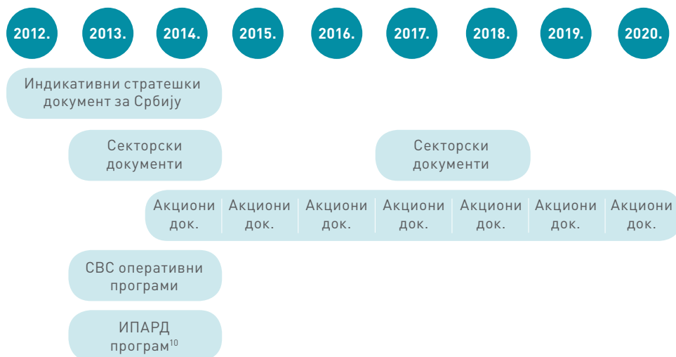
Табела 1: Календар процеса програмирања